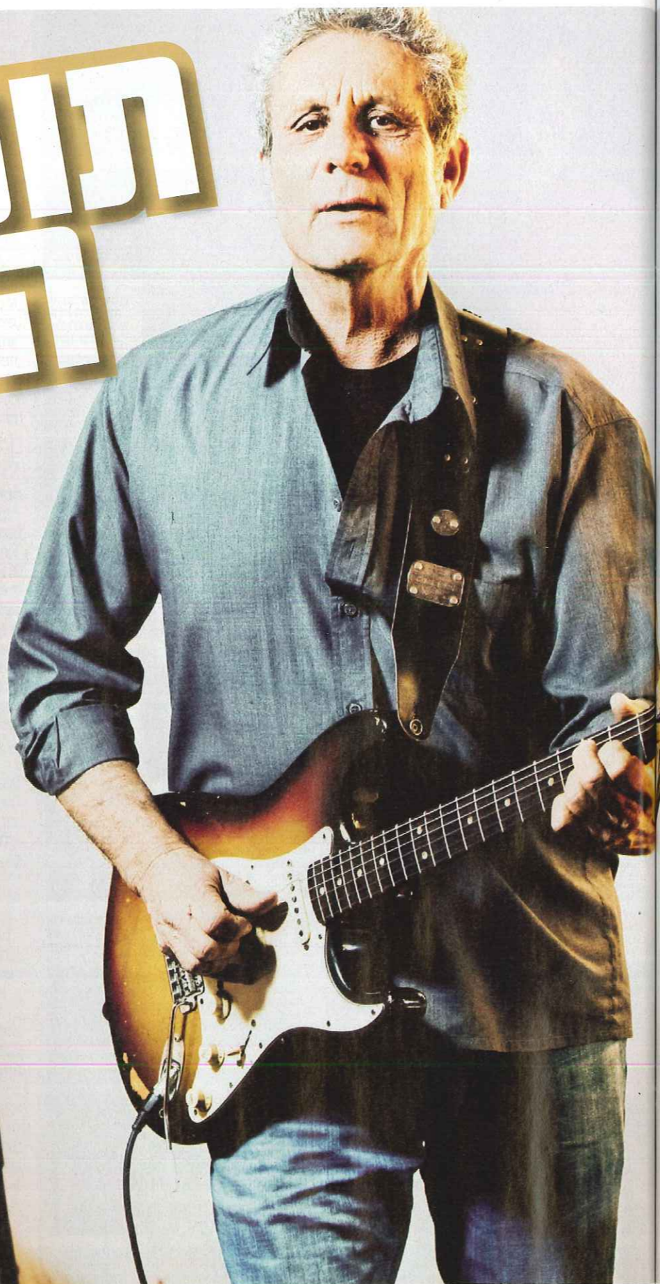
"בסוף היום אני גיטריסט. וכמו כן שאני חושב שאני הגיטריסט הטוב ביותר בארץ." עדר