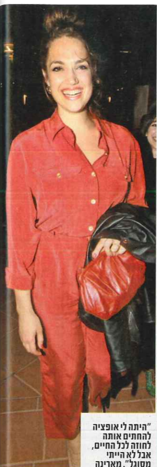
"היתה לי אופציה להחתיים אותה לחוזה לכל החיים, אבל לא הייתי מסוגל". מארינה