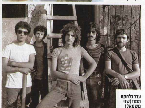
עדר בלהקת תמוז (שמאל)