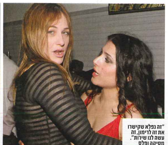
"זה נפלא שקישרו את זה לרימון, זה עשה לנו שירות". מסיקה ופולס