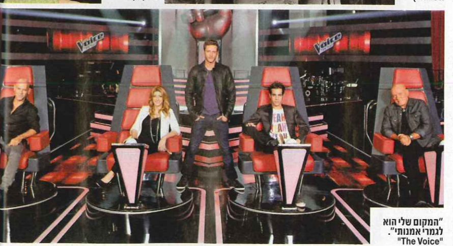
"המקום שלי הוא לבמור אמנות". "The Voice"