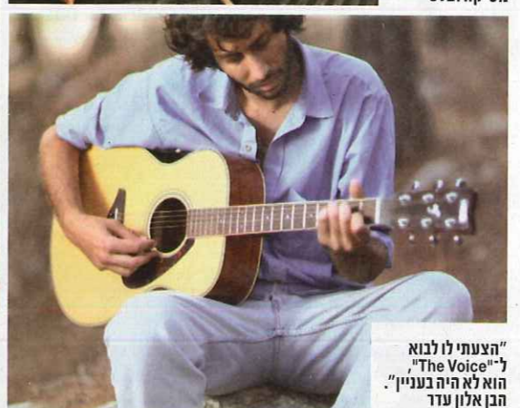
"הצעתי לו לבוא ל-'The Voice', הוא לא היה בעניין". הבן אלון עדר